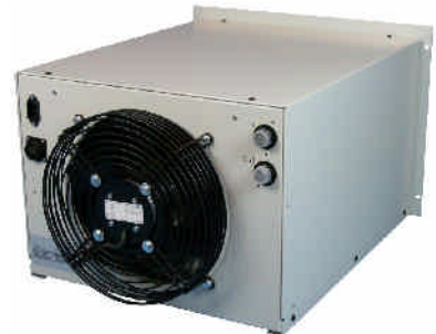
ProfiCool Exactus PCEX 020 (Rückansicht)

Weitere Optionen/Zubehör sowie Pumpenalternativen auf Anfrage.