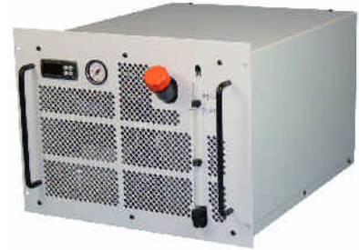
ProfiCool Exactus PCEX 020